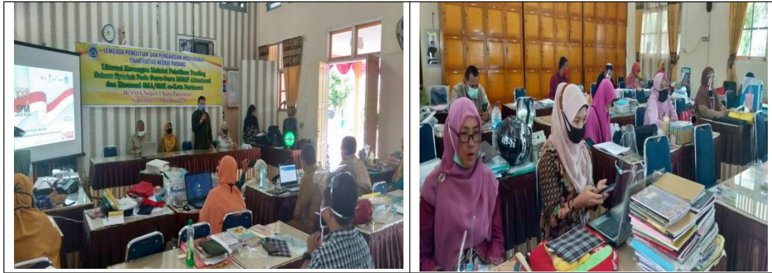
Gambar 2. Kegiatan Pelatihan dan Demonstrasi Saham Syariah

Pemateri yang memberikan pelatihan adalah orang-orang yang kompeten pada bidangnya, seperti Kepala Kantor Bursa Efek Indonesia wilayah Sumatera Barat, Dosen-dosen Fakultas Ekonomi Universitas Negeri Padang. Pemateri dari dosen memberikan materi tentang pengenalan pasar modal, sedangkan untuk literasi saham syariah diberikan oleh kepala kantor BEI wilayah Sumatera Barat. Untuk pembukaan rekening efek para mitra dilakukan melalui Galeri Investasi Bursa Efek Indonesia Universitas Negeri Padang, jadi para guru-guru pada pelatihan ini diminta untuk membuka rekening efek, sehingga mereka dapat langsung mempraktekkan bagaimana cara membeli saham syariah. Dalam kegiatan ini tim pelaksana melakukan evaluasi terhadap pengetahuan peserta dengan menggunakan konsep diskusi, sehingga peserta bisa mengungkapkan apa saja yang mereka belum pahami. Dengan diadakannya diskusi maka diharapkan dapat terlihat pemahaman dan pengetahu peserta tentang materi yang diberikan.