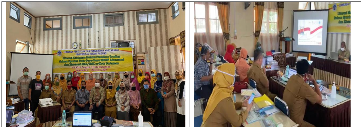
Gambar 3. Foto bersama setelah kegiatan dan saat pemberian materi

Pemateri yang memberikan pelatihan adalah orang-orang yang kompeten pada bidangnya, seperti Kepala Kantor Bursa Efek Indonesia wilayah Sumatera Barat, Dosen-dosen Fakultas Ekonomi Universitas Negeri Padang. Pemateri dari dosen memberikan materi tentang pengenalan pasar modal, sedangkan untuk literasi saham syariah diberikan oleh kepala kantor BEI wilayah Sumatera Barat. Untuk pembukaan rekening efek para mitra dilakukan melalui Galeri Investasi Bursa Efek Indonesia Universitas Negeri Padang, jadi para guru-guru pada pelatihan ini diminta untuk membuka rekening efek, sehingga mereka dapat langsung mempraktekkan bagaimana cara membeli saham syariah. Dalam kegiatan ini tim pelaksana melakukan evaluasi terhadap pengetahuan peserta dengan menggunakan konsep diskusi, sehingga peserta bisa mengungkapkan apa saja yang mereka belum pahami. Dengan diadakannya diskusi maka diharapkan dapat terlihat pemahaman dan pengetahu peserta tentang materi yang diberikan.